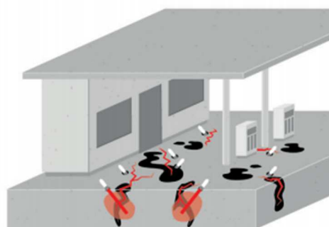
Naprawa rys zanieczyszczonych olejami/ tłuszczami