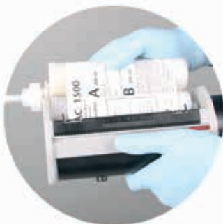
Wkładanie kartusza do pompy WEBAC. QuickSet